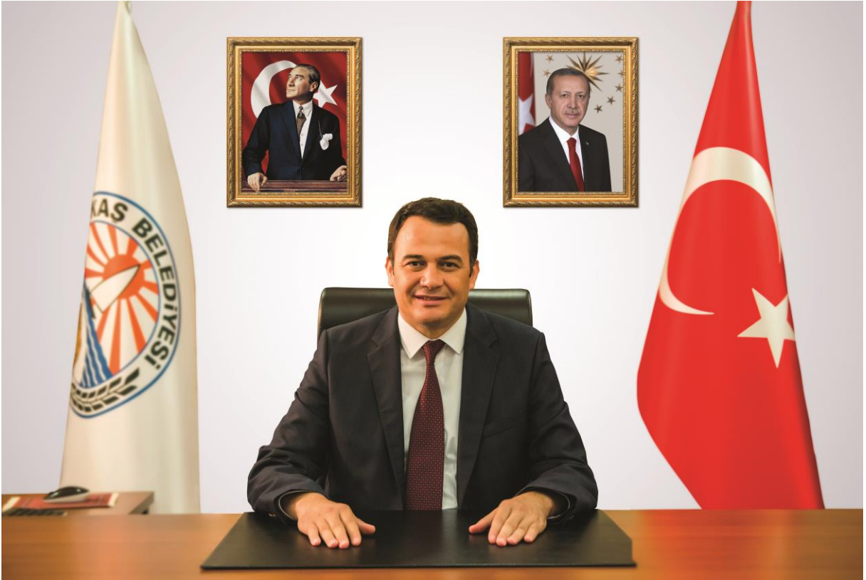
Mutlu ULUTAŞ Kaş Belediye Başkanı