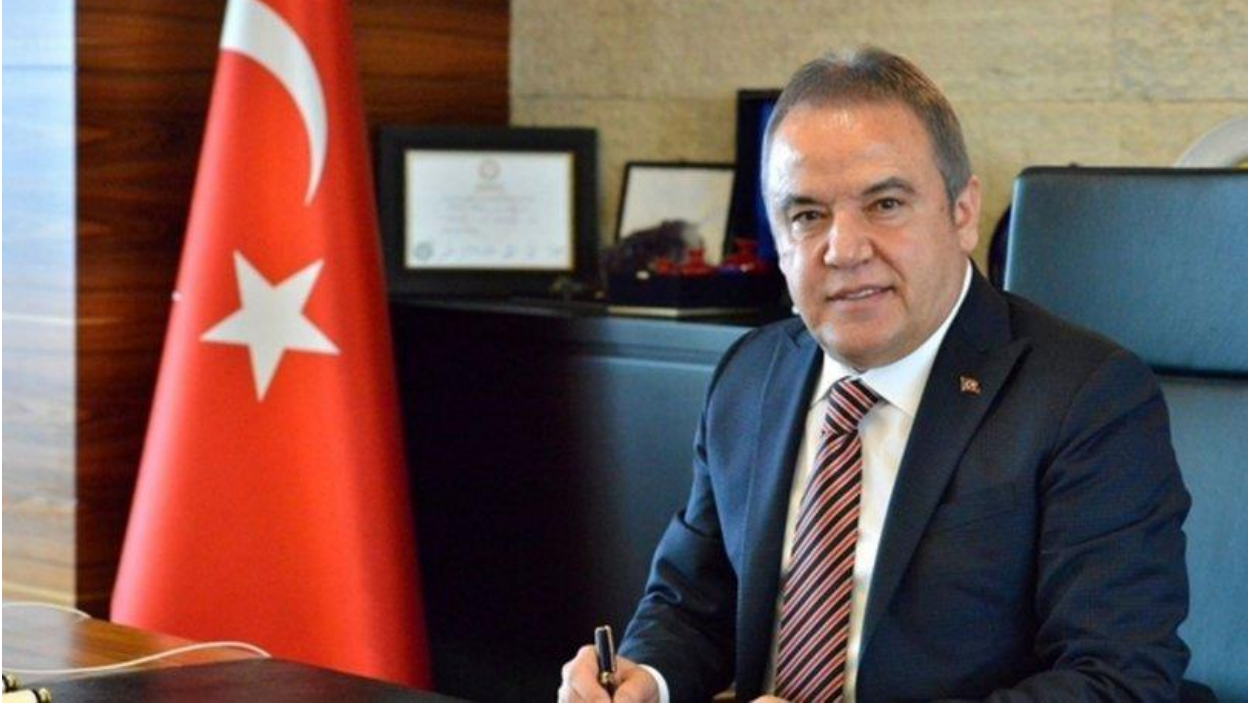
MUHİTTİN BÖCEK Antalya Büyükşehir Belediye Başkanı