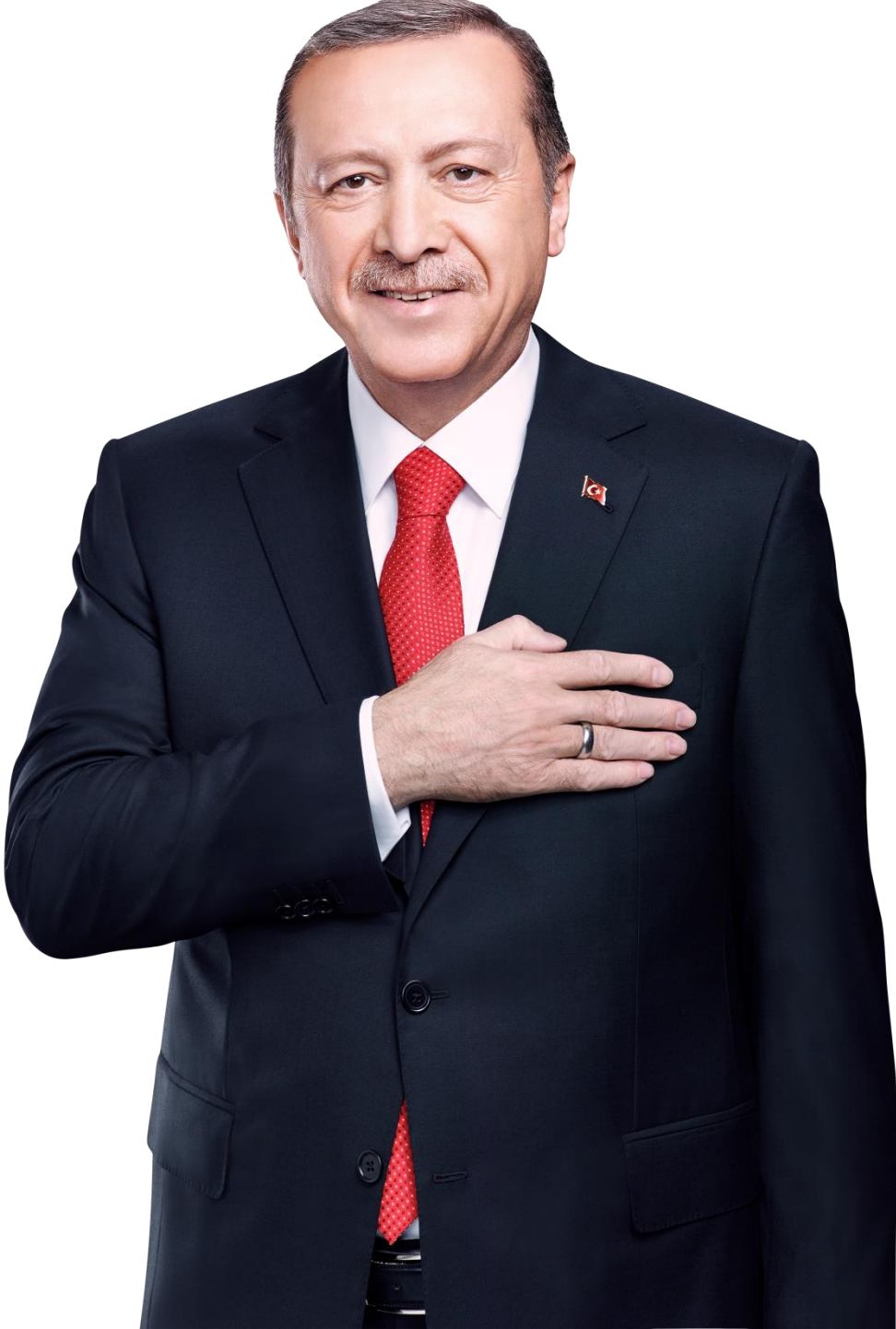
RECEP TAYYİP ERDOĞAN Cumhurbaşkanı