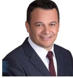
Mutlu ULUTAŞ Belediye Başkanı