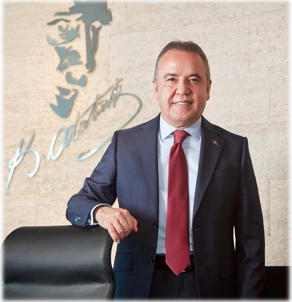
Muhittin BÖCEK Antalya Büyükşehir Belediye Başkanı