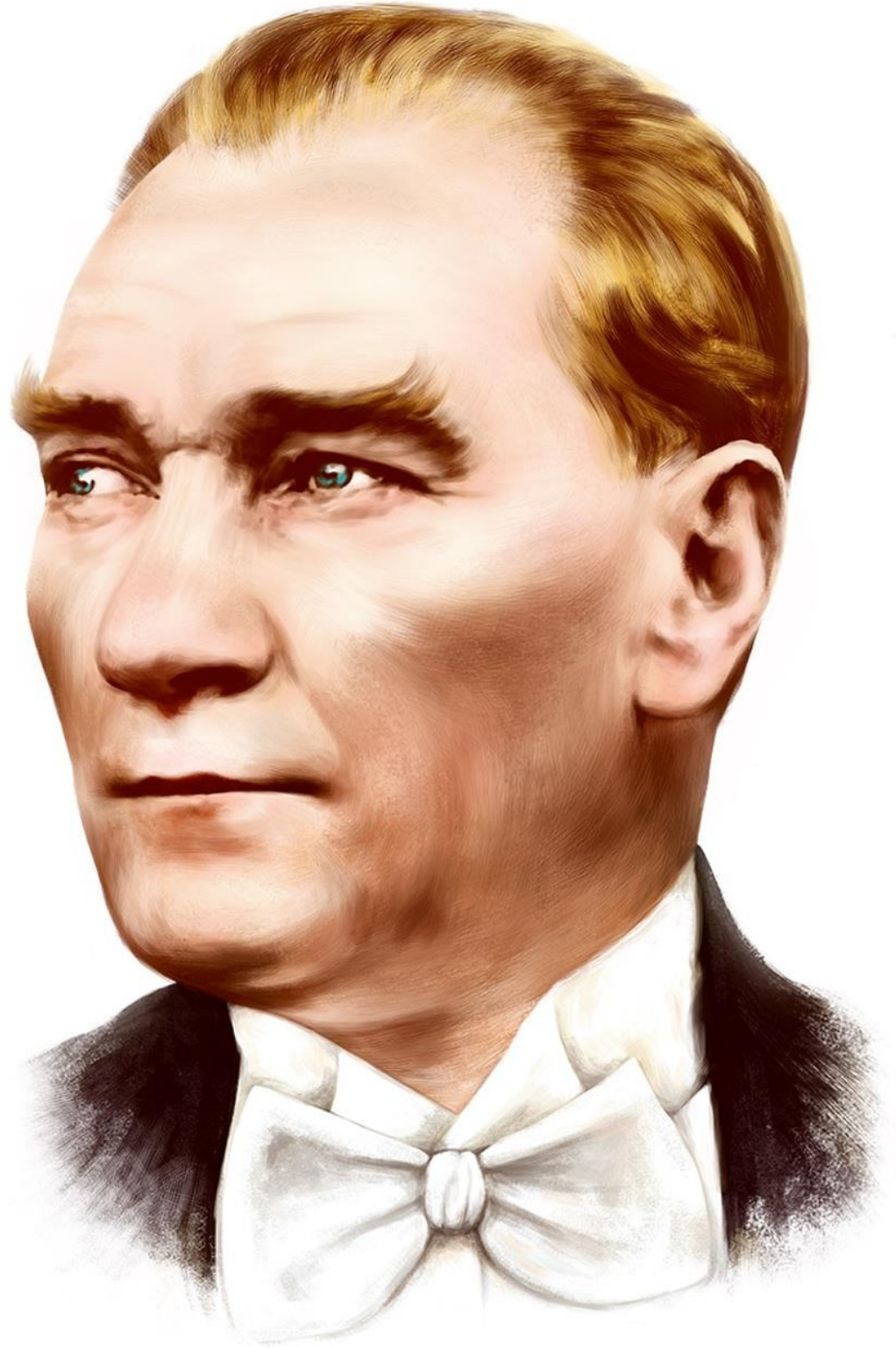
Mustafa Kemal ATATÜRK