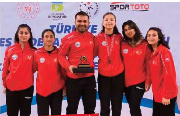
Kaş Belediyesi'nin güreşçisinden bronz madalya