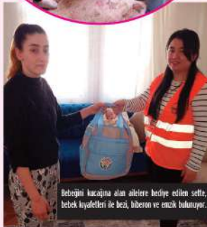
Bebeğini kucacına alan ailelere hediye edilen sette, bebek kıyafetleri ile bezi, biberon ve emzik bulunuyor.