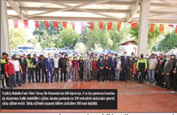
Yeşilköy Mahallesi'nde Hilmi Toksoy İlk Ortaokulu'nda 600 öğrenciyi, il ve ilçe jandarma komutanlığı ekiplerince trafik dedektifleri eğitimi, kuralın parkurunda ise 300 motosiklet sürücüsüne güvenli sürüş eğitimi verildi. Sürüş eğitimini başarıyla bitiren sürücülere 300 kask dağıldı.